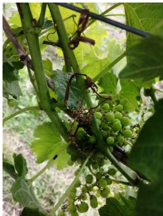
Grappolo di Garganega