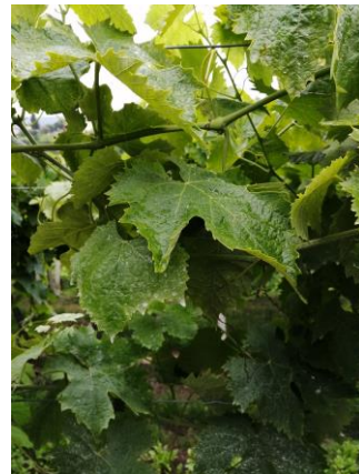
TREBBIANO di Soave