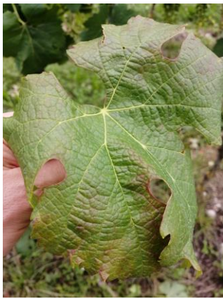
Foglia di MERLOT