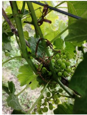
Grappolo di Garganega