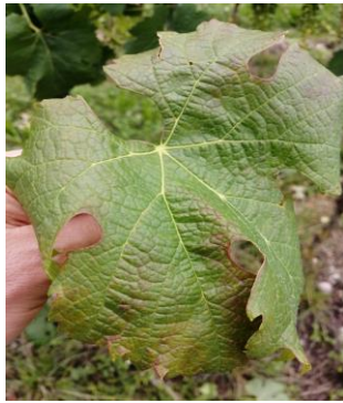
Foglia di MERLOT