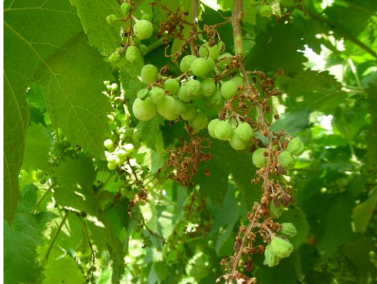
Sintomi su TREBBIANO di SOAVE