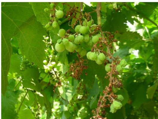
Sintomi su TREBBIANO di SOAVE

I sintomi successivi possono interessare diversi organi della pianta o solo una parte. Il sintomo classico è il ripiegamento dei margini fogliari verso il basso , che inizialmente può essere solo accennato, per poi aumentare in maniera progressiva fino alla non lignificazione dei tralci .