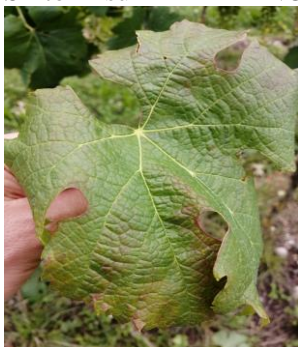
Foglia di MERLOT