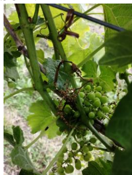
Grappolo di Garganega TREBBIANO di Soave